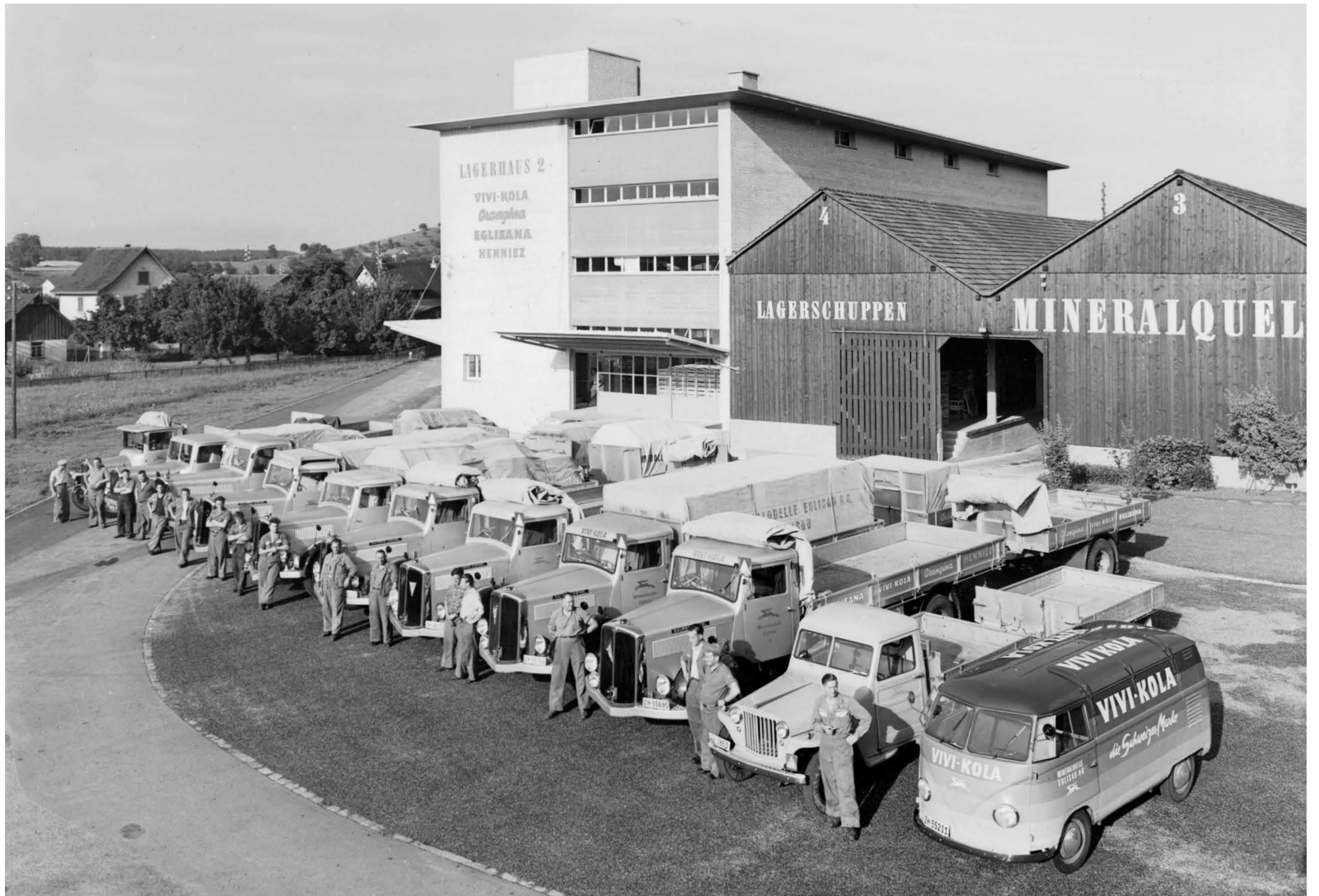
LKW-Parade vor der Mineralquelle, 1954