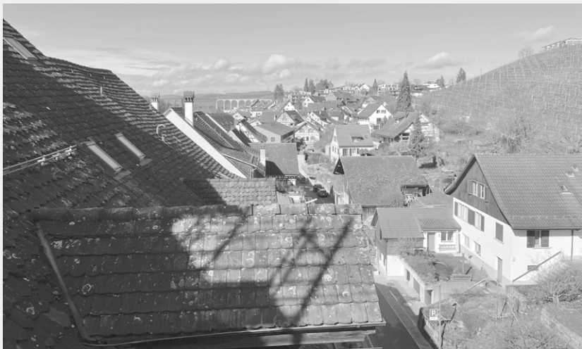
Blick Richtung Eisenbahnbrücke