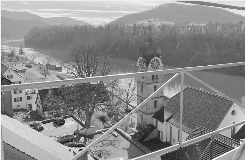
Blick vom Giebel des Chlösterli