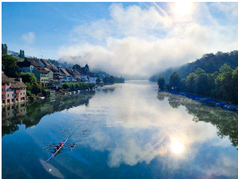
Wanda Pfeifer, 3. Platz Fotowettbewerb 2022