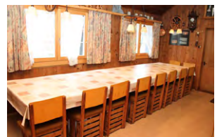
Küchenraum, Platz für 16 Personen