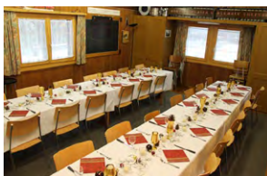
Proberaum, Platz für 32 Personen