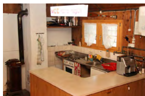
Küche mit Herd, Boiler, Geschirr