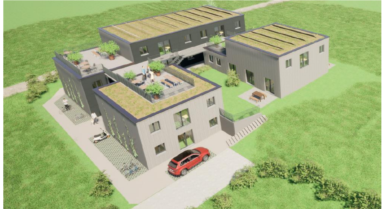
Visualisierung einer möglichen Umsetzung (Gemeinde Eglisau)