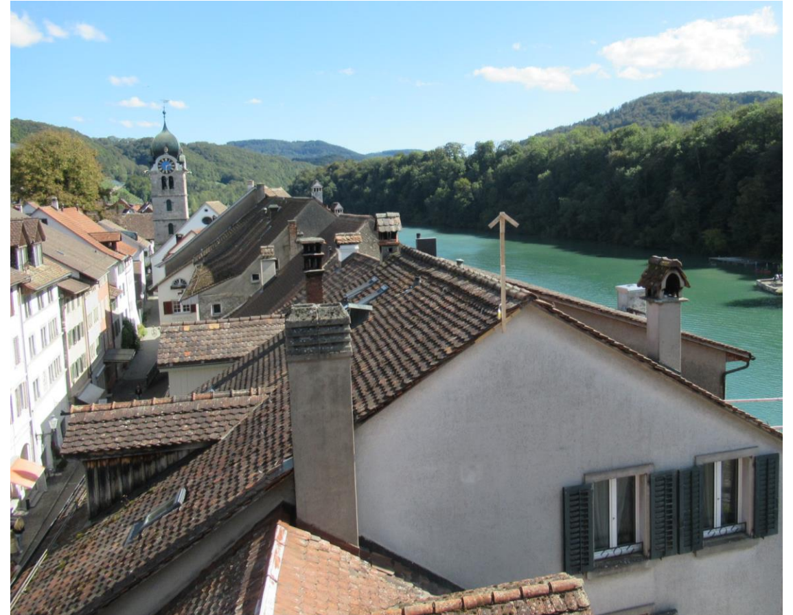
Abbildung Dächer des Städtli (Gemeinde Eglisau)