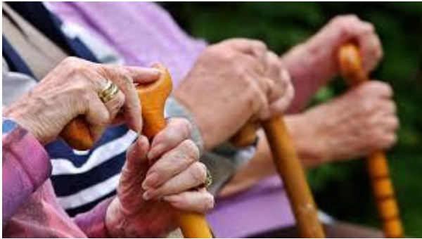
Spürbare Zunahme des älteren Bevölkerungsanteiles