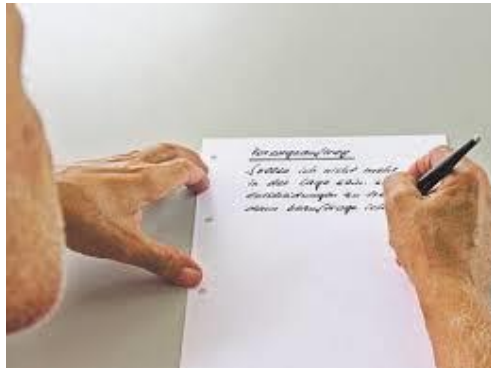
Eigenhändig verfasstes Dokument